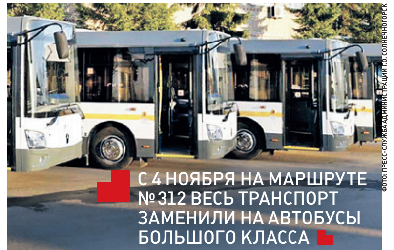
С 4 НОЯБРЯ НА МАРШРУТЕ №312 ВСЕ ТРАНСПОРТ ЗАМЕНИЛИ НА АВТОБУСЫ БОЛЬШОГО КЛАССА