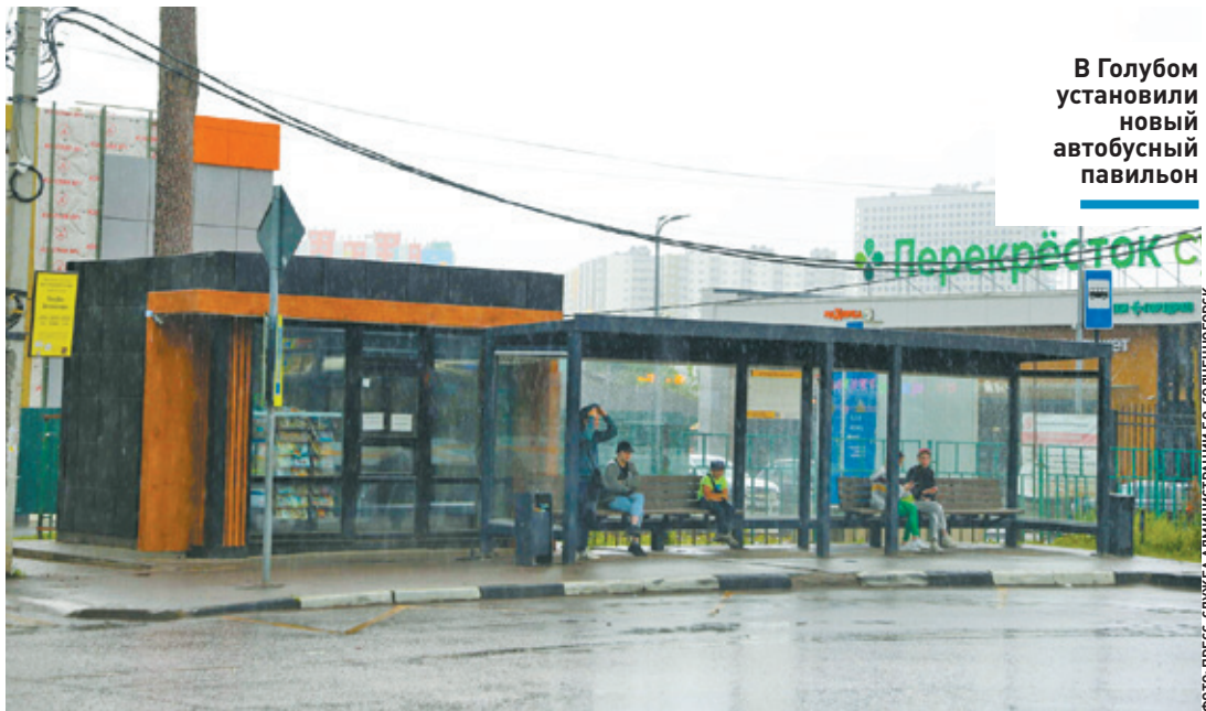
В Голубом установили новый автобусный павильон